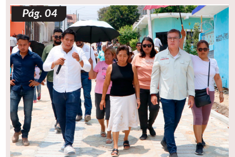
Paco Chacón fortalece la infraestructura de Paso Limón con "Calles Humanistas"