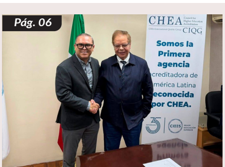
Recibe UNACH dictamen preliminar favorable de la evaluación a la gestión institucional de los CIEES