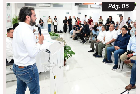
Transparencia, innovación y certeza: Secretaría de Educación avanza con la Agenda para la Transformación Digital